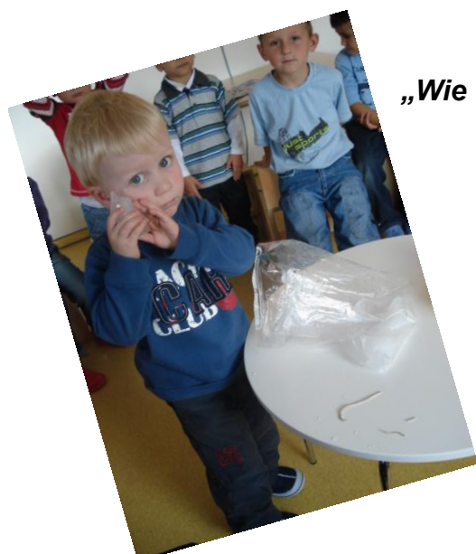
„Wie Wasser auch sein kann“