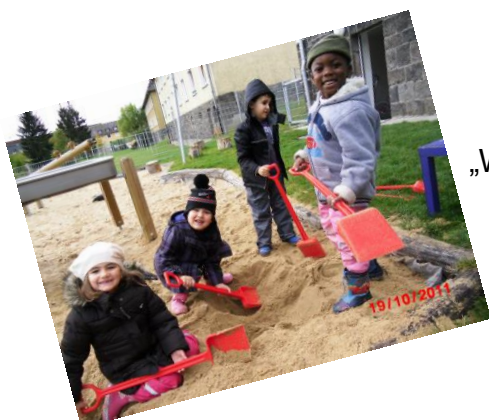
„Wohin fließt das Wasser“

Ein Beispiel ist das Projekt „Haus der kleinen Forscher“ Einmal in der Woche, nach dem gemeinsamen Morgenkreis, führt jeweils eine Gruppe kleine naturwissenschaftliche Experimente durch, die den Kindern Naturphänomene nahe bringen soll: