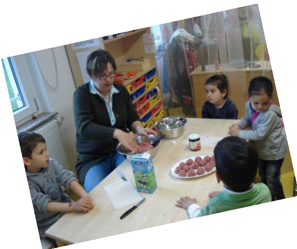
„Köttbullen selber machen“

Projektarbeit dient dazu, mit Kindern in Lebenssituationen einzutauchen, in denen sie kognitive, soziale, motorische und emotionale Kompetenzen erwerben, für ihre Entwicklung wichtige Erfahrungen machen und mit Menschen außerhalb der Kindertagesstätte in Kontakt kommen können.