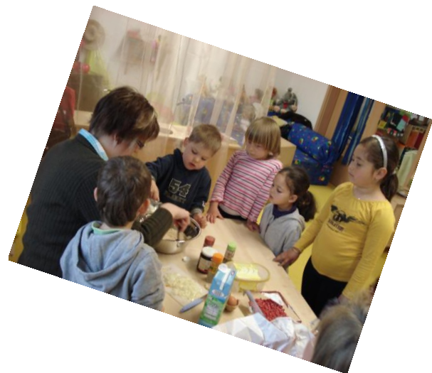
„Schweden ist so nah“

Die weitaus meisten Lernerfahrungen werden im Verlauf eines Projektes gemacht. So kommt es im Rahmen von Projekten beispielsweise zu: